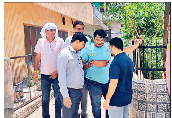
रोहतक। शहर में घर-घर जाकर लार्वा की जांच करती स्वास्थ्य विभाग की टीम।

शहर में डेंगू ने दस्तक दे दी है। स्वास्थ्य विभाग द्वारा जांच किए गए 638 लोगों के ब्लड सैपल में एक मरीज कंफर्म हुआ है। जिसका उपचार शुरू कर दिया गया है। मरीज महम एरिया में मिला है। इसके साथ ही स्वास्थ्य विभाग अलर्ट हो गया है। घर-घर लार्वा जांच के लिए टीम भेजी जा रही है।