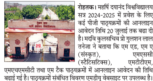
रोहतक। महर्षि दयानंद विश्वविद्यालय सत्र 2024-2025 में प्रवेश के लिए कई पीजी पाठ्यक्रमों की आनलाइन आवेदन तिथि 20 जुलाई तक बढ़ा दी है।