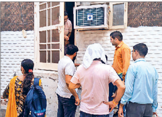
डेंगू को लेकर जागरूकता फैलाई जा रही है। टीम घर-घर जाकर लार्वा जांच कर रही है।