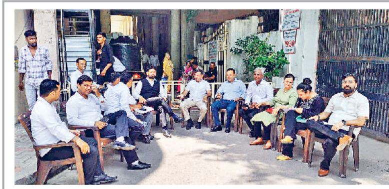
रोहतक। समाधान शिविर में लोगों की शिकायतें सुनें अधिकारी।